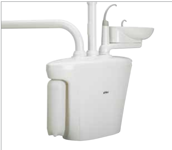
Système d'alimentation en eau propre.

Le crachoir en porcelaine pivote pour accommoder la bonne position du patient. Une bouteille d'eau de deux litres, facile à remplir, fournit un approvisionnement continu en eau à travers plusieurs procédures. Le support central offre un large espace de stockage permettant d'ajouter des accessoires tel des séparateurs d'amalgame et des systèmes d'aspiration.