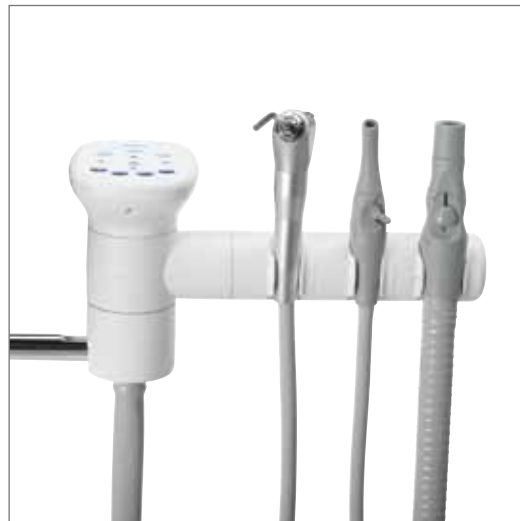
Support à trois positions illustré avec les options clavier et seringue.

Situez le support aspiration à trois positions et télescopique qui offre un accès convenable au patient.