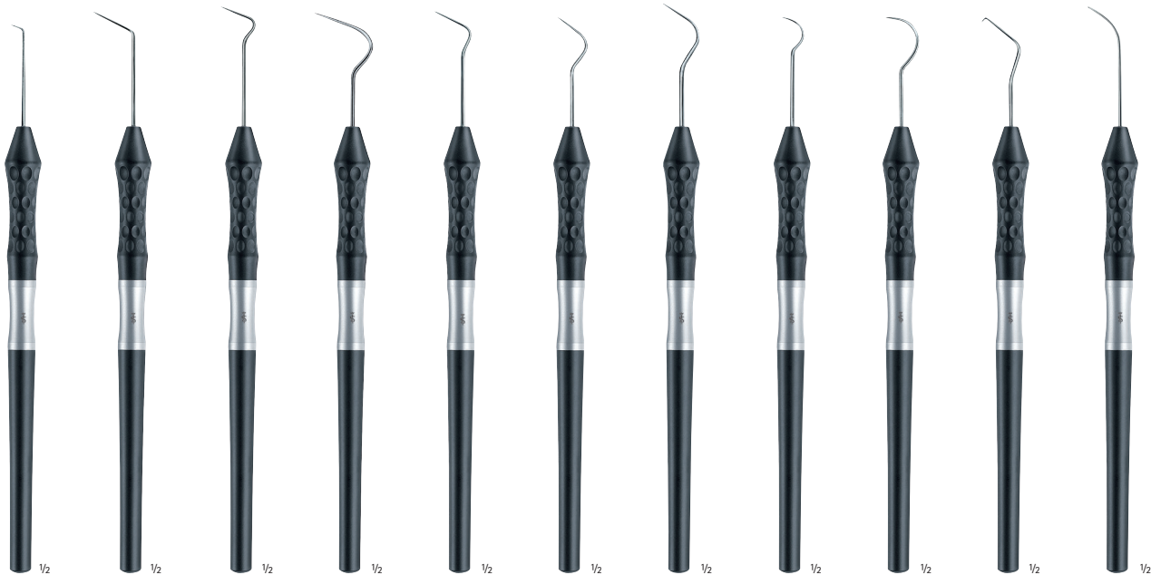
DA802R Fig. 6 160 mm, 6 1/4", fine DA806R Fig. 6A 160 mm, 6 1/4", fine DA808R Fig. 8 160 mm, 6 1/4", fine DA809R Fig. 8A 160 mm, 6 1/4", fine DA810R Fig. 9 160 mm, 6 1/4", fine DA811R Fig. 9A 160 mm, 6 1/4", fine DA812R Fig. 9B 160 mm, 6 1/4", fine DA814R Fig. 2 160 mm, 6 1/4", fine DA816R Fig. 23 160 mm, 6 1/4", fine DA818R Fig. 17 160 mm, 6 1/4", fine DA823R EXS 3A 165 mm, 6 1/2", fine