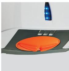
2 BUSES D'AIR SEPARÉES POUR UNE MEILLEURE EFFICACITÉ DE SECHAGE