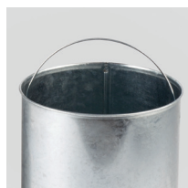
BAC INTÉRIEUR AVEC ANSE POUR FACILITER L'USAGE